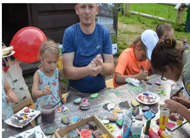
Piknik "Niedziela w GPN" - 15.08.2021