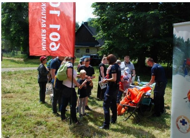
Piknik "Niedziela w GPN" - 27.06.2021

Edukacyjnego GPN. Piknik na terenie Parku Dworskiego w Porębie Wielkiej odbył się 27 czerwca, natomiast 15 sierpnia zorganizowano piknik na polanie Trusiówka w Lubomierzu-Rzekach.