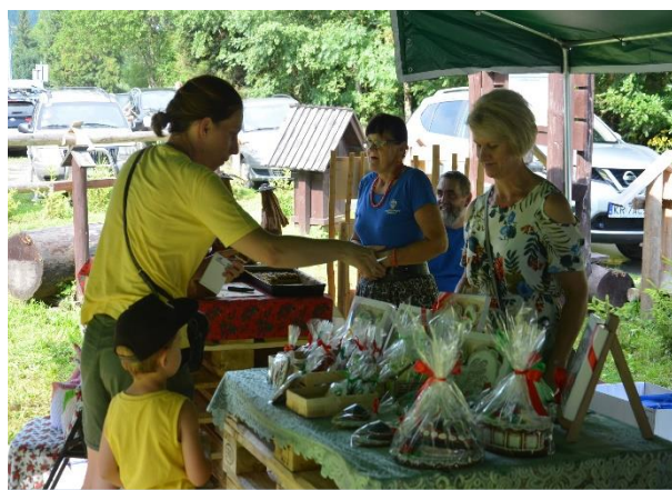
Piknik "Niedziela w GPN" - 15.08.2021