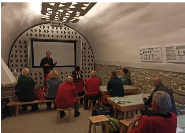
Szkolenie przewodników beskidzkich - 25.09.2021