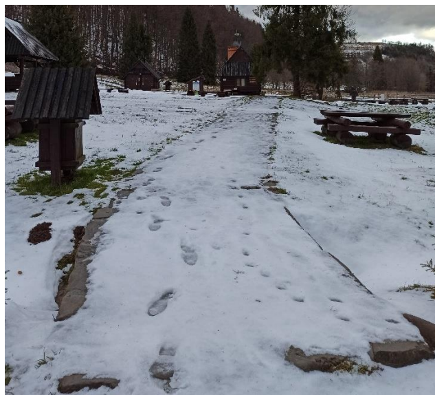
Fot. 1 i 2 Wymiana infrastruktury technicznej miejsca biwakowego Trusiówka.