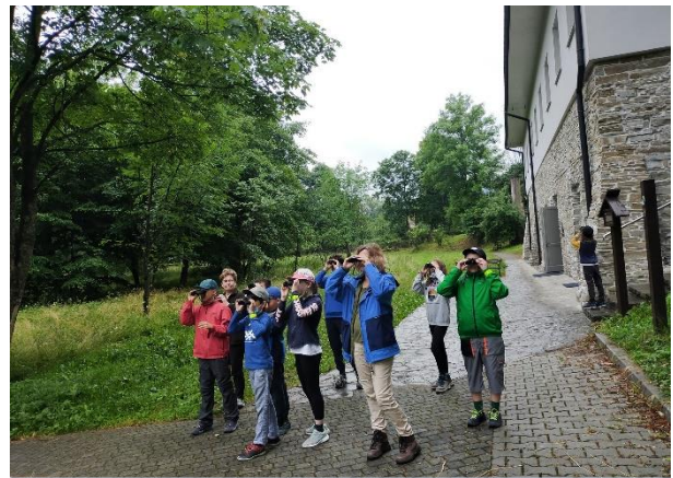
Zajęcia z rozpoznawania ptaków