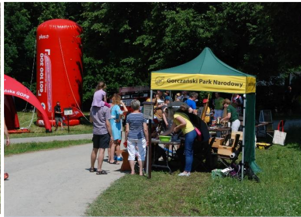
Stoisko GPN w czasie Pikniku "Niedziela w GPN"