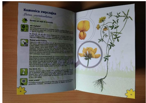
Książka "Kwiaty parku dworskiego w Porębie Wielkiej"