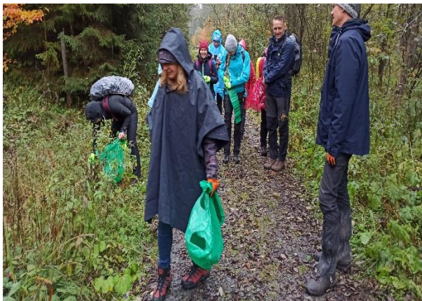
Pracownicy Banku Gospodarstwa Krajowego w czasie akcji sprzątnięcia szlaków