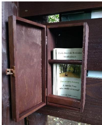
Skrzynki na ulotki z questem zamontowane w terenie