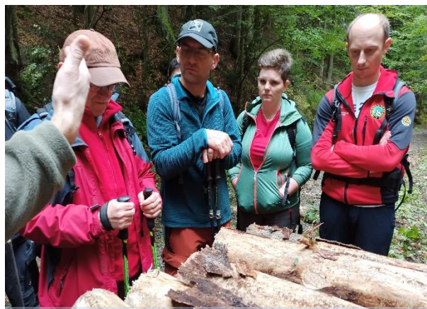
Szkolenie przewodników beskidzkich - 25.09.2021