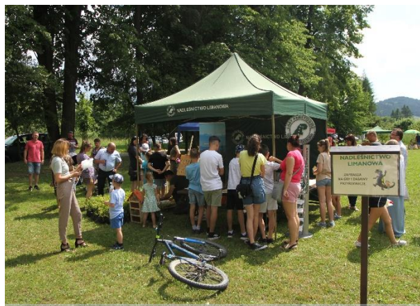
Piknik "Niedziela w GPN" - 27.06.2021