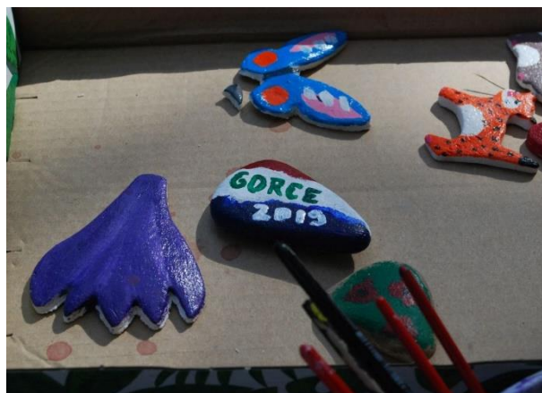
Piknik w Parku Dworskim w Porębie Wielkiej - 18.06.2019r.