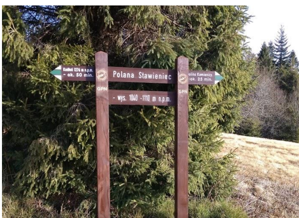
Wymiana małej infrastruktury drewnianej - nowy drogowy skaz w O.O. Turbacz.