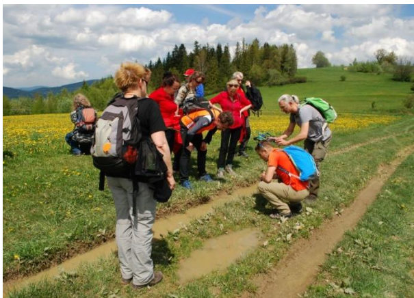
Szkolenie przewodników beskidzkich - 18.05.2019r.