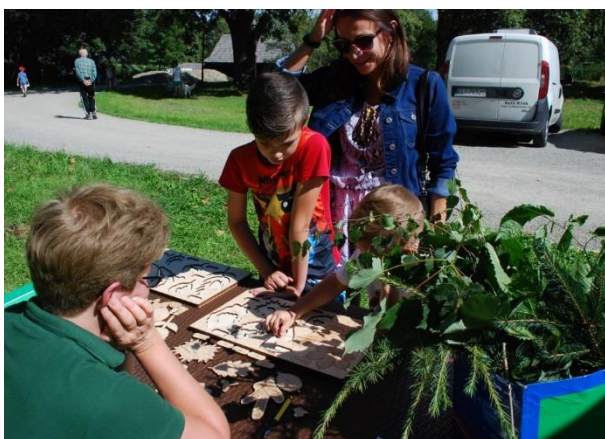
Piknik w Parku Dworskim w Porębie Wielkiej - 18.06.2019r.