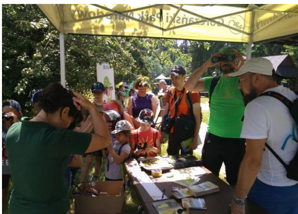
Piknik na polanie Trusiówka w Lubomierzu-Rzekach - 16.06.2019r.

W 2019 roku Gorczański Park Narodowy we współpracy z Nadleśnictwem Limanowa, Powiatem Limanowskim, Komendą Wojewódzką Policji, Grupą Podhalańską GOPR, Gminą Mszana Dolna, Gminą Niedźwiedź oraz lokalnymi artystami, rękodzielnikami i właścicielami gospodarstw agroturystycznych zorganizował dwa pikniki turystyczne „Niedziela w Gorczańskim Parku Narodowym” popularyzujące nasz region, turystykę przyrodniczą i kulturową oraz propagujące bezpieczne wędrowanie. Pikniki miały również na celu promocję miejsc biwakowych na terenie Gorczańskiego Parku Narodowego oraz Ośrodka Edukacyjnego GPN. Piknik na polanie Trusiówka w Lubomierzu-Rzekach piknik odbył się 16 czerwca, natomiast 18 sierpnia zorganizowano piknik na terenie Parku Dworskiego w Porębie Wielkiej.