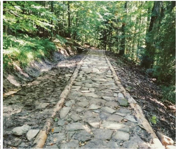
Trasa ścieżki edukacyjnej Dolina potoku Jaszczce po wykonaniu prac.