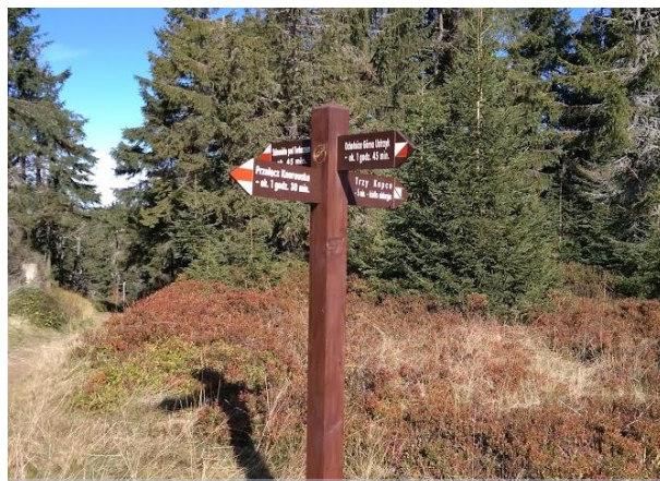
Wymiana małej infrastruktury drewnianej - nowy drogowy skaz w O.O. Jaworzyna.