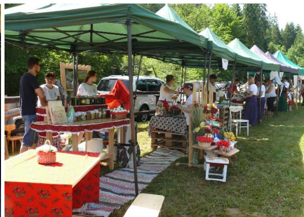
Piknik na polanie Trusiówka w Lubomierzu-Rzekach - 16.06.2019r.