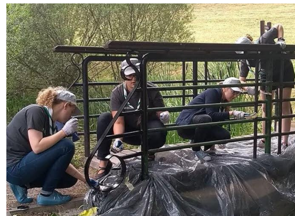
16.07.2019r. Harcerska pomoc - 254 WDW Płomienie