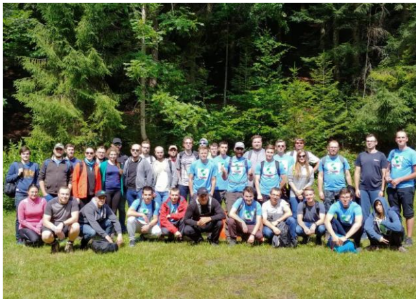
15.07.2019r. Wolontariusze - pracownicy Sabre Polska