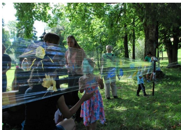
Piknik w Parku Dworskim w Porębie Wielkiej - 18.06.2019r.