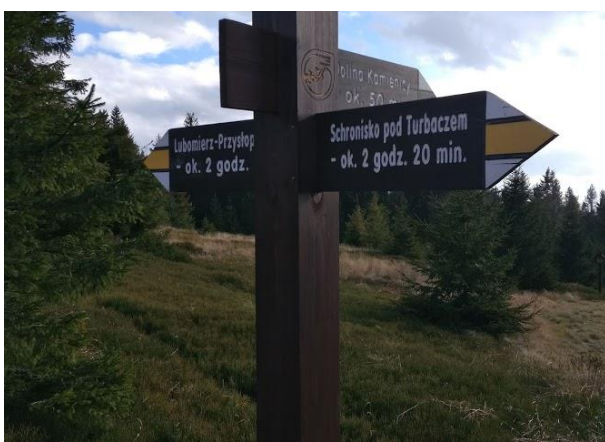
Wymiana małej infrastruktury drewnianej - nowy drogowy skaz w O.O. Turbacz.