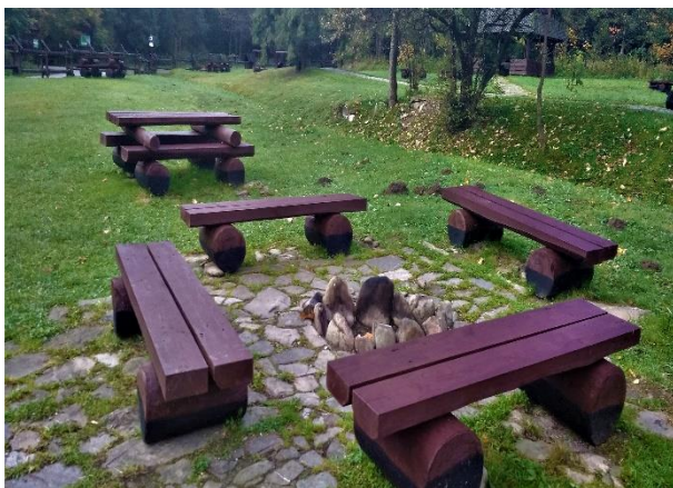
Wymiana małej infrastruktury drewnianej miejsc biwakowych - nowe ławki.

Koszt realizacji działania wyniósł 31 200,00 zł