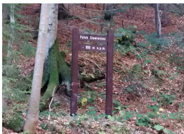
Wymiana małej infrastruktury drewnianej - nowy drogowy skaz w O.O. Turbacz.