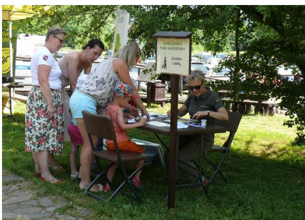
Piknik na polanie Trusiówka w Lubomierzu-Rzekach - 16.06.2019r.