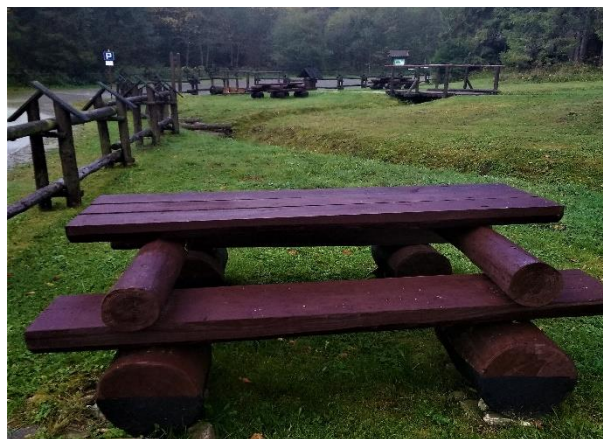
Wymiana małej infrastruktury drewnianej miejsc biwakowych - nowe ławostoły.