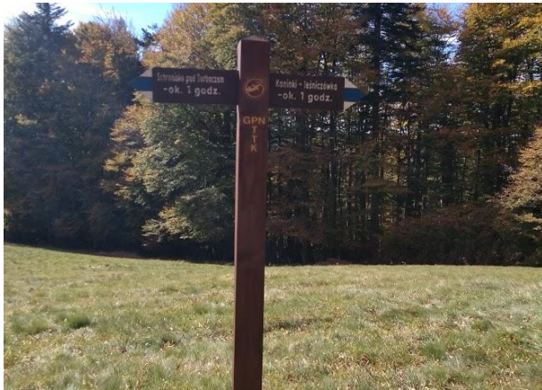
Wymiana małej infrastruktury drewnianej - nowy drogowskaz w O.O. Suhora.

Koszt realizacji działania wyniósł 4 556,80 zł