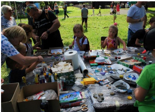
Piknik w Parku Dworskim w Porębie Wielkiej - 18.06.2019r.