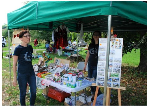
Piknik w Parku Dworskim w Porębie Wielkiej - 18.06.2019r.