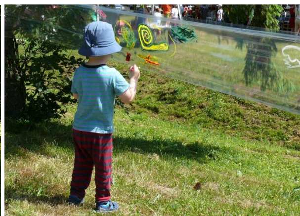
Piknik na polanie Trusiówka w Lubomierzu-Rzekach - 16.06.2019r.