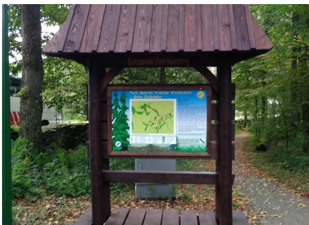
Wymiana małej infrastruktury drewnianej - nowa tablica w O.O. Dwór.