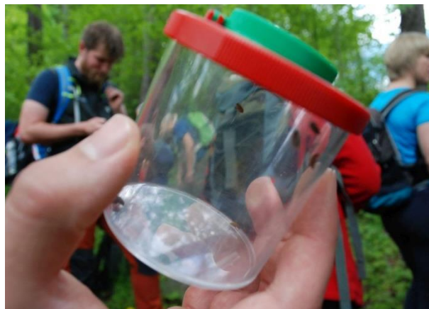
Szkolenie przewodników beskidzkich - 18.05.2019r.

Dodatkowo w ramach projektu „Adaptacja zabytkowego obiektu architektonicznego na Ośrodek Edukacyjny Gorczańskiego Parku Narodowego wraz z zagospodarowaniem edukacyjnym parku dworskiego w Porębie Wielkiej” przeprowadzono jednodniowe warsztaty dla przewodników górskich, w trakcie których zaprezentowano ofertę edukacyjną Ośrodka Edukacyjnego GPN oraz ekspozycję przyrodniczą GPN. W warsztatach uczestniczyło 14 osób.