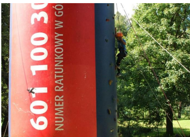
Piknik w Parku Dworskim w Porębie Wielkiej - 18.06.2019r.