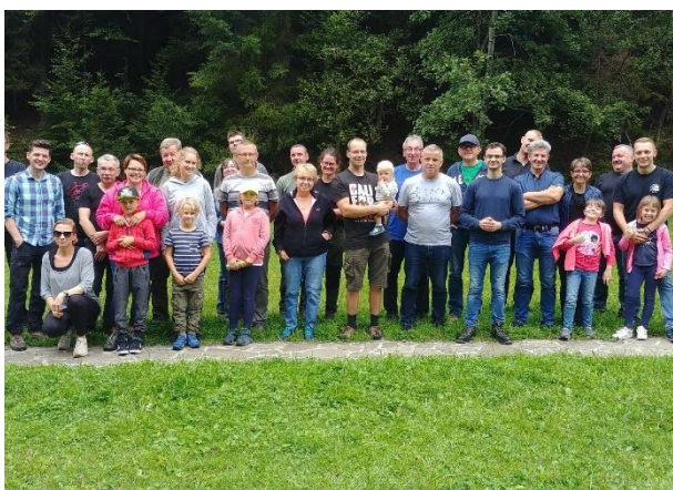
07.09.2019r. Wolontariusze - pracownicy CumminsLTD Kraków