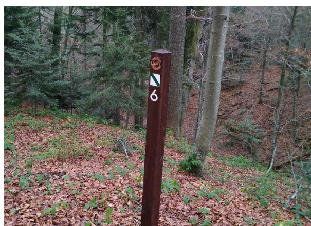
Wymiana małej infrastruktury drewnianej - nowy słupek przystankowy w O.O. Jaworzyna.