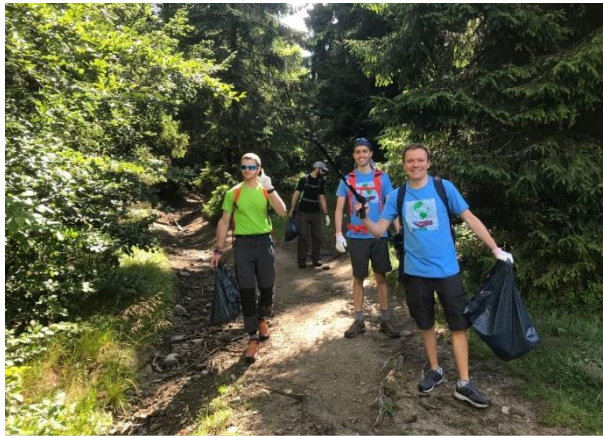
15.07.2019r. Wolontariusze - pracownicy Sabre Polska