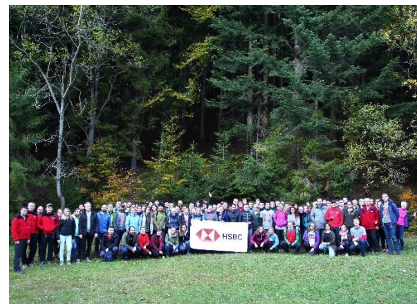
12.10.2019r. Wolontariusze - pracownicy HSBC