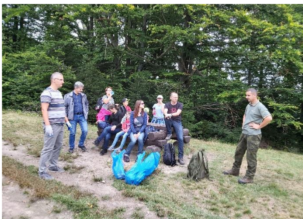
07.09.2019r. Jedna z grup pracowników Cummins LTD Kraków