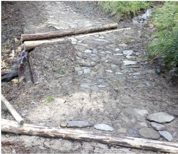
Trasa ścieżki edukacyjnej Dolina potoku Jaszczce po wykonaniu prac.

Koszt realizacji działania wyniósł 140 857,42 zł