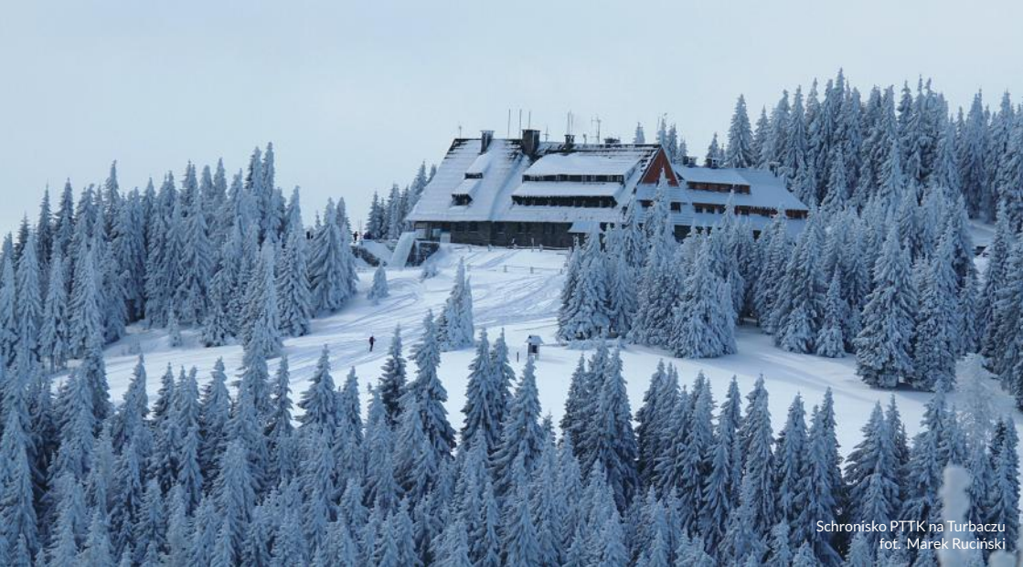
Schronisko PTTK na Turbaczu