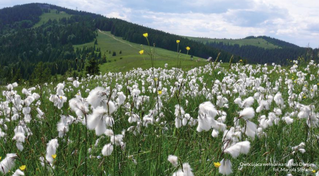
Owocująca wełnianka na Hali Długiej