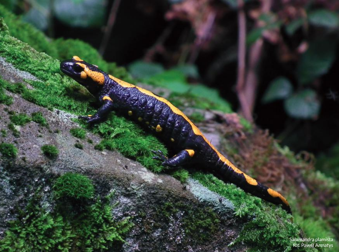
Salamandra plamista