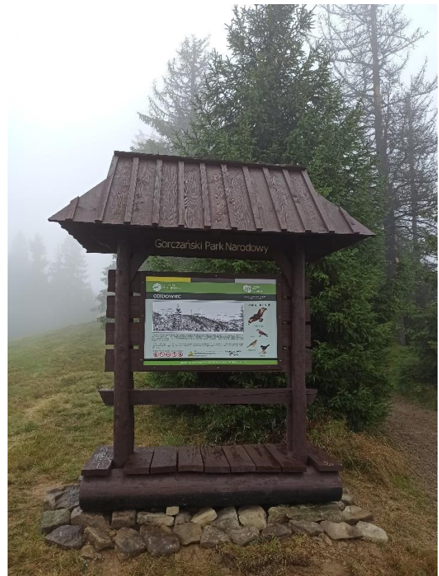
Fot. 4-5 Oznakowanie enklawy Jasionów oraz nowa tablica na szlaku czerowym – wzdłuż granic GPN.