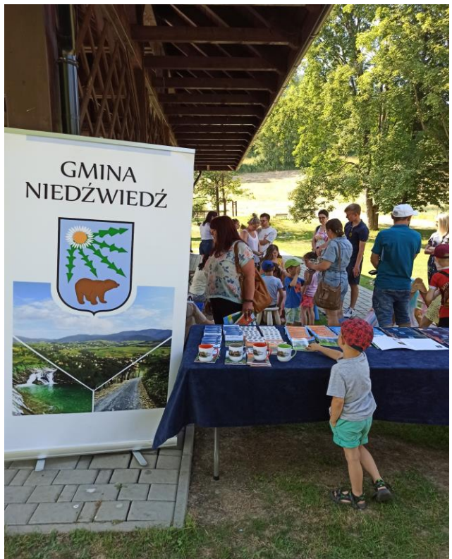
Fot. 11-19 Pikniki turystyczne w Porębie Wielkiej i w Lubomierzu na polanie Trusiówka.