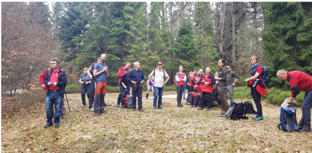
Fot. 8-10 Szkolenie przewodników beskidzkich w 2022 roku.