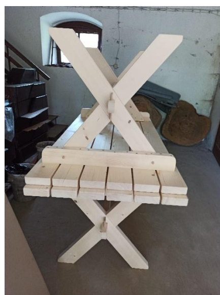
Fot. 4-7 Efekty pracy wolontariuszy oraz ławki i stoły (przed malowaniem) zakupione w ramach darowizny.