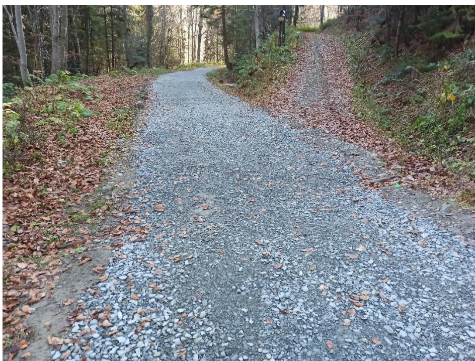
Fot. 3 Szlak niebieski w dolinie Kamienicy.