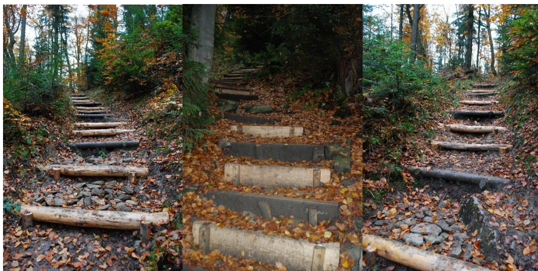
Uzupełnione stopnie na stromych odcinkach zielonych szlaków przez Turbaczyk i Obidowiec.