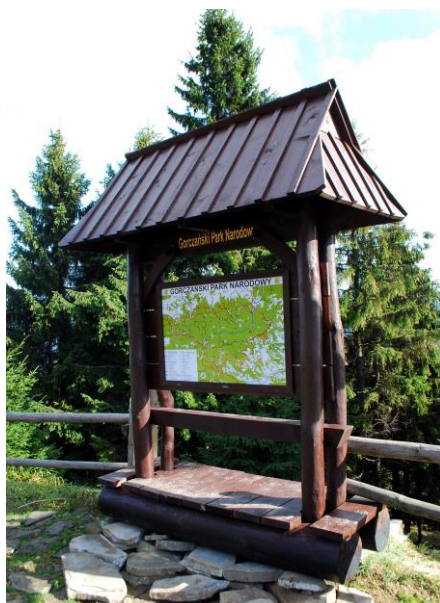
Nowa tablica z mapą GPN przy schronisku pod Turbaczem.