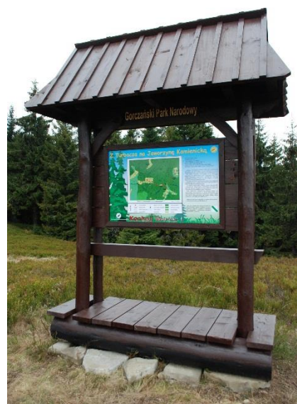
Nowa tablica ścieżki „Z Turbacza na Jaworzynę”