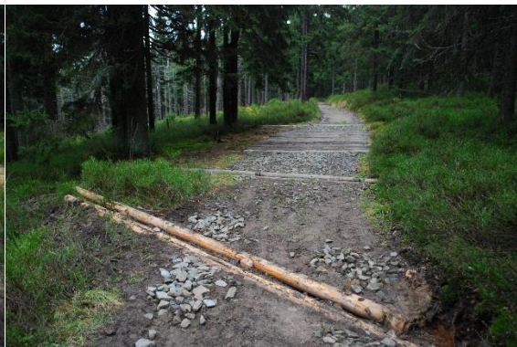
Uzupełnienie sączków na zielonym szlaku z polany Gabrowska na Jaworzynę.