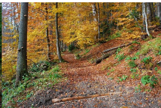
Uzupełnione sączki i ubytki na żółtym szlaku przez Borek i Zapadłe.