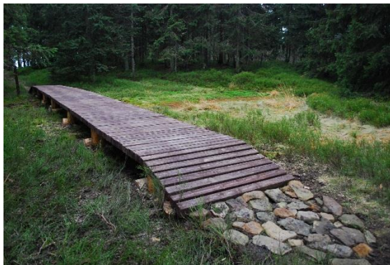
Nowa kładka przez torfowisko na ścieżce „Z Turbacza na Jaworzynę” .